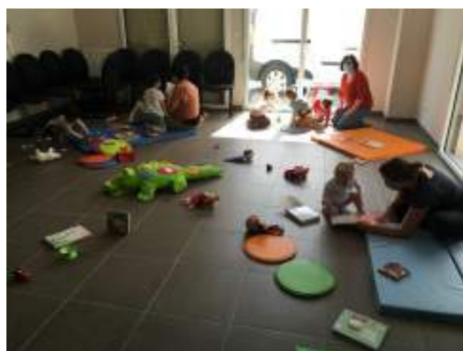
Salle des Alizées – atelier du lundi matin

Les ateliers ludiques du lundi matin sont ouverts aux familles qui souhaitent partager avec leur enfant un moment de jeux dans un espace dédié et échanger avec des professionnels de la Petite Enfance.